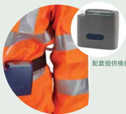
配套提供橡胶保护套